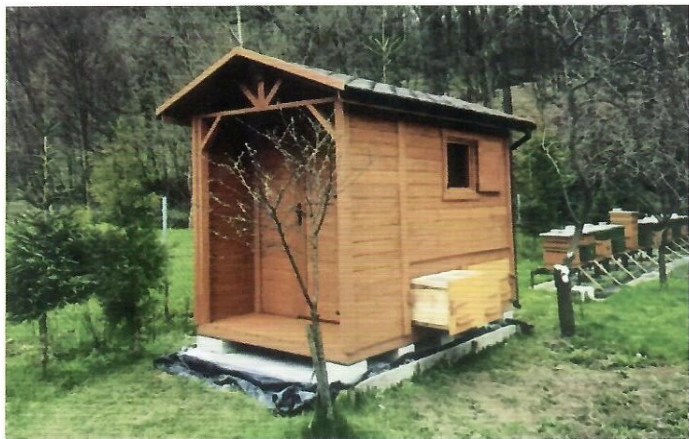
4. Domek do uloterapii zawierający cztery ule, gdzie pszczoły są oddzielone siatką