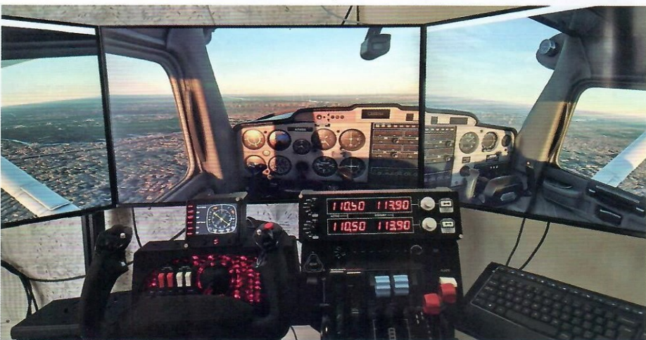
3. Symulator samolotowy pozwalający na odzwierciedlenie lotu każdą maszyną latającą