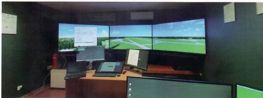
1. Symulator wieżowy w pełni zintegrowany z symulatorem samolotowym