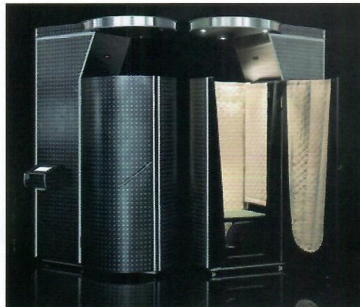
5. Kriosauna, temperatura -120 do -180 stopni C

się fenomenem uzdrawiających właściwości muzyki dopiero od lat 20. XX wieku. Już pierwsze badania wykazały, że muzyka wpływa na emocje, poprawia nastrój, relaksuje fizycznie i psychicznie