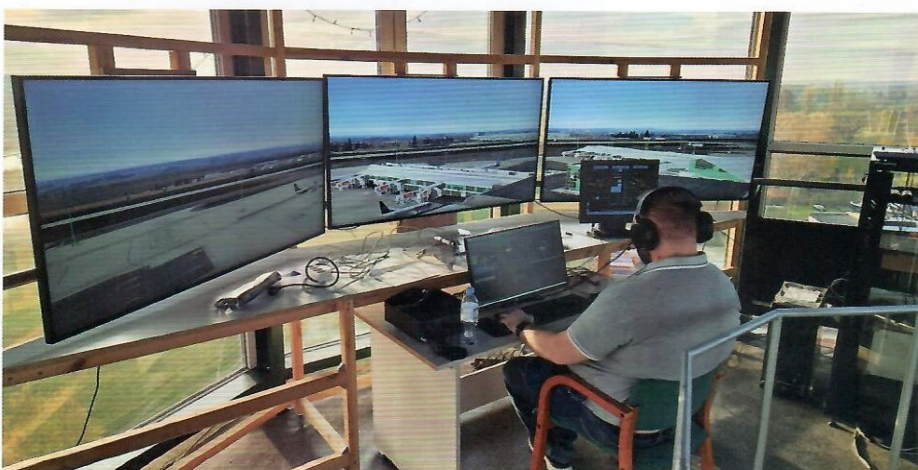
2. Symulator wieżowy ze skanerem lotniczym pozwalającym na nasłuch rzeczywistych częstotliwości lotniczych