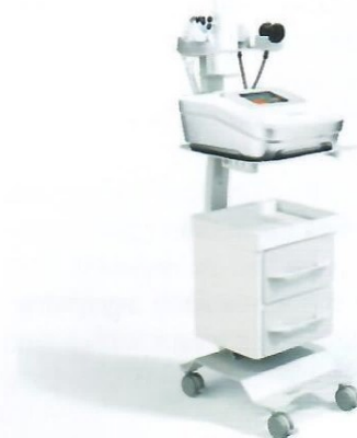
7. Winback Beauty, zabieg rozluźnia i relaksuje