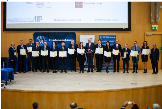
Fot. 1. Wręczenie legitymacji członkom AIP przyjętym na poprzednich Zgromadzeniach Ogólnych (a) i bieżącym (b)