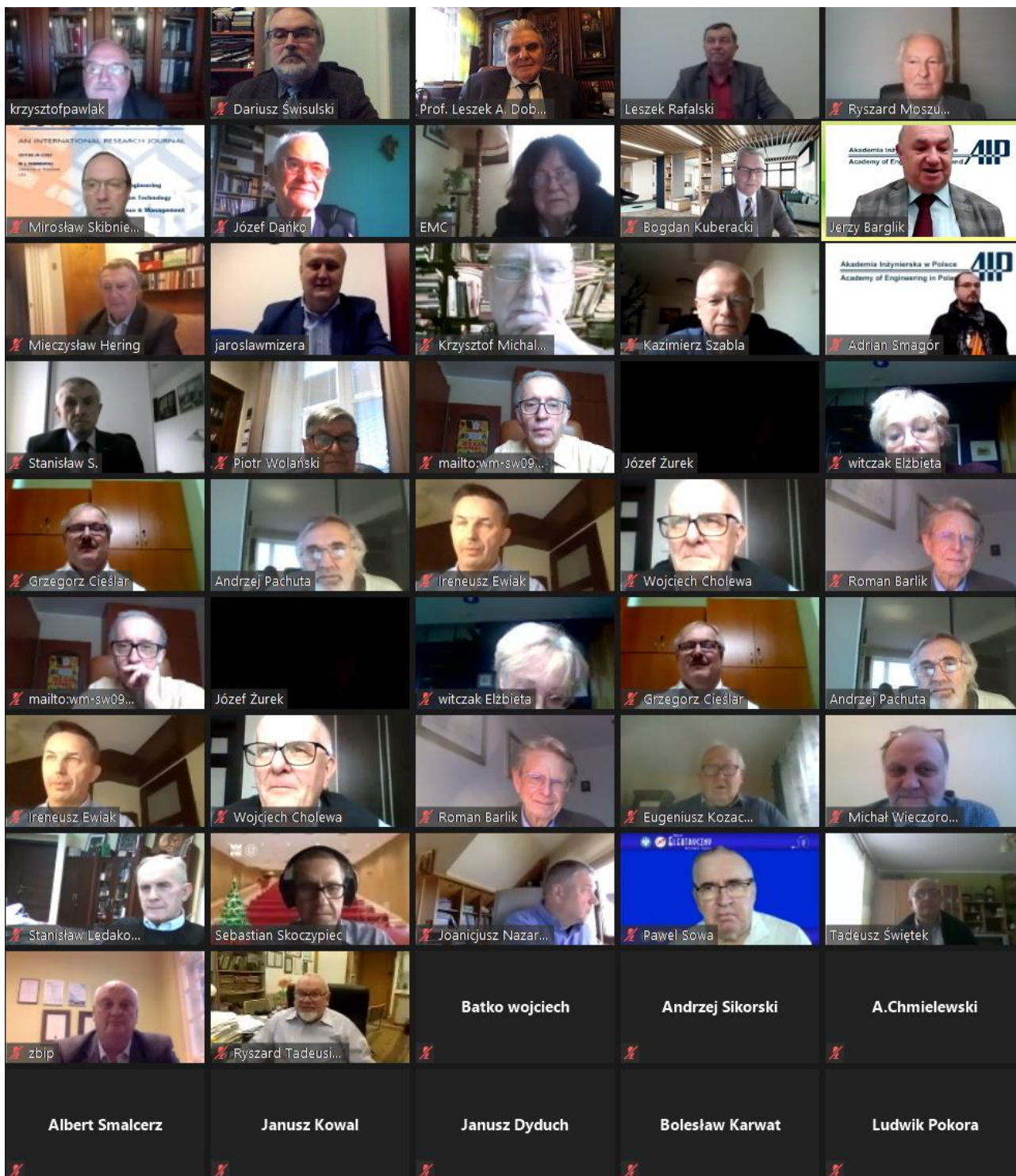
"Fotografia zbiorowa" uczestników XXXV Zgromadzenie Ogólne Akademii Inżynierskiej w Polsce